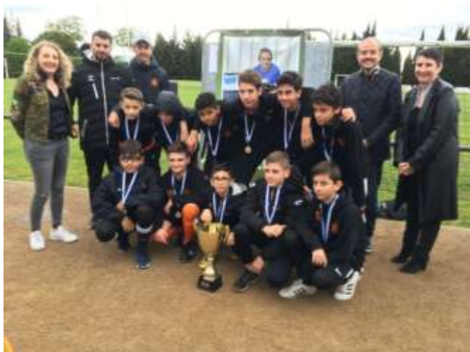
Les U13 de FC Trèbes