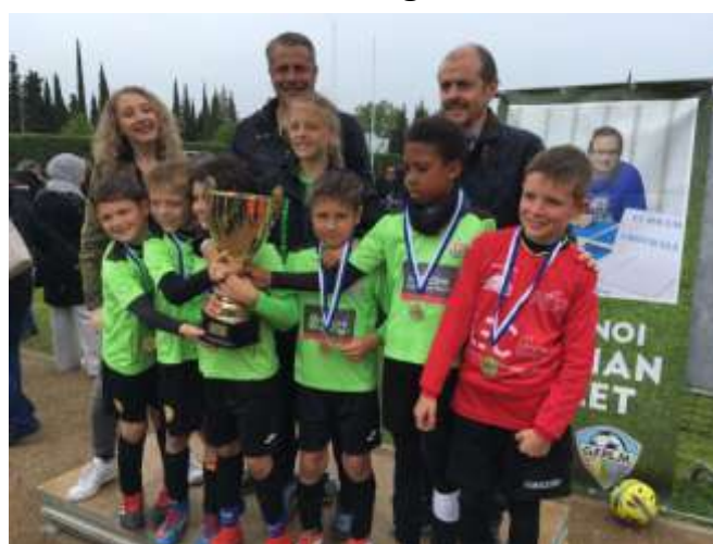
Les U9 de Saint Estève