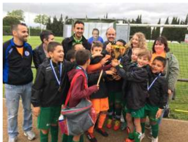
Les U11 de l'UF Lézignan