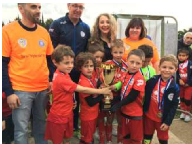
Les U7 du GFC